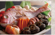
天然鯛の活造りと淡路島名物の宝楽焼・淡路牛の焼きしゃぶを味わうまんぷく会席

淡路島の海の幸は名だたる料亭でも高い評価を誇り、特に真鯛は大正、昭和、平成と四代にわたって天皇陛下即位時の大嘗祭などに献上するほど。その真鯛をはじめ地元漁港に集まる旬の地産を、淡造りや淡路島の郷土料理「宝楽焼」などでお召し上がりいただく会席コースです。