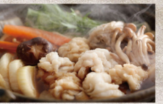
【特選】 錦秋鮎を味わう秋の味覚づくし会席〜淡路牛・紅葉鯛ほか秋の山海の幸とともに〜

来たるべき数多い冬に向けて上質な鮎を堪能し丸々と肥えた旨み溢れる錦秋鮎と走りの松茸をはじめとする豊かな秋の恵りとの出会いを贅沢に味わうコース。ほかにも淡路島のブランド食材・淡路牛や紅葉鯛など、豊饒の島からの旬の海の幸、山の幸を存分に味わえます。