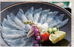
冬の旬を味わう「淡路島3年とらふぐ」てっちり鍋プラン

門門御旅にほど近い地元福良湾で3年の手間ひまをかけて育てられた淡路島3年とらふぐは、自然に限りなく近い環境の中で旬のひと味と凍り固まって獲らされた、身が凝り引き締まり旨味がたっぷり。黒花ではその淡路島3年とらふぐをてっちり鍋をはじめとしたコースでお楽しみいただけます。