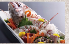
【島の海幸と淡路牛】夢海游 淡路島総料理長★秋のスペシヤリテ

料理長が厳選する淡路島の秋の特選食材をギュッと詰め込んだ豪華な特別料理をお召し上がりいただくグルメプラン。旬の食材である紅葉鯛をはじめ、淡路牛、伊勢海老などをふんだんに使った料理の数々をお召し上がり、プライベートな空間でお食事が楽しめる個室料理「磯辺亭」でゆっくりとお召し上がりください。