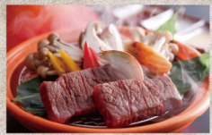
淡路牛宝楽ステーキと南あわじの地魚を味わう磯石コース・目にも鮮やかな島育ち野菜とともに

豊かな島の自然がもたらす美味しい秋は、あなたの五感を魅了します。 古くから、皇室や朝廷へ食材を献上し若狭・志摩と並び「御食国(みけつくに)」と称される食の宝庫、淡路島。実る秋、その恵みをたっぷり堪能させませんか。 この時期おすすめ海の幸は、「紅葉鯛」。秋の鯛は「紅葉鯛」と称され、春の桜鯛に劣らないほど美味で、身が締まり、しつとりとした上質な脂の味わいが特徴。さらには、ぶりっかりの身と独特の甘さを持つ伊勢海老や波り蟹、サザエなどどこ馳走つくし。万葉の昔から伝わる郷土料理「宝楽焼」でお召し上がりください。蓋つきの土鍋に那智黒石を敷き詰り、昆布の上に新鮮な魚介類を並べて蒸し焼きにすることで魚介の味わいがぎゅっと凝縮され、素材の旨さを逃がしません。蓋を開けた時の磯の香り、肉厚の身が口の中へほぐれる口当たりは絶品。旬の島野菜とともに、素材が持つ濃厚な旨味を存すところなく楽しんでいただけます。 また、山の幸は、さつまいもやレタスなどの旬の野菜、みかんやレモン、いちじくなどの果物、新米などにも美味しいものが目押し。とくに、神戸牛や松阪牛の素牛としても知られる但馬牛のルーツである「淡路牛」は必ず味わっていただきたい逸品。その肉質は筋繊維が細かく、サシが入りやすいので、熱を加えると豊かな風味ととろける舌ざわりが評判です。すき焼きやしゃぶしゃぶ、石焼ステーキなどで肉本来の旨みを実感してください。