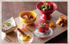
淡路島西海岸の鮮魚と島の旬の食材を愉しむディナープラン

島の食材をスパニッシュ風にアレンジした鏡海流キュイズを味わうプラン。色鮮やかなタパス風前菜をはじめ、淡路島西湖に揚がる魚介の造りや旬の調味料、淡路牛を使った一品など、日本料理に洋のテイストを合わせた料理の致々を夕陽の美しいレストランでお召し上がりいただけます。