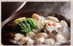
「冬の味覚づくし」淡路島3年とらふぐをフルコースで味わうふぐづくし会席

得も言われぬ独特の旨味と食感をお楽しみいただける淡路島3年とらふぐを、てっちり、てっさなどの定番メニューはもちろん、白子入り茶碗蒸しや焼きふぐでもお楽しみいただけます。コラーゲンたっぷりでお肉にもおすすめのとらふぐのフルコースを旬の見えるダイニングでゆっくりと。