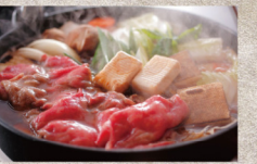
淡路牛と松茸のすき焼と紅葉鯛・伊勢海老の姿造りプラン

淡路牛は細い筋繊維と目みのあるサシが特徴で、火を通すと絶妙の柔らかなさ。本プランでは秋の味覚の王様「松茸」とともに料理長自慢の割り下にした絡ませたすき焼でお楽しみいただけます。他にも脂の乗った紅葉鯛やぶりの伊勢海老、穴子など、秋の味覚をご堪能いただけます。